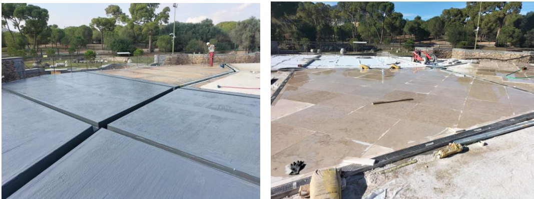
Imatges de les obres a la coberta de pedra

Amb l'execució d'aquesta obra s'ha aconseguit resoldre els problemes de manca d'estanquitat de la coberta de la Cripta, tant en la part de cobriment de la planxa de zinc del porxo d'accés com en la terrassa amb cobriment de peces de pedra de sobre de l'edifici del cos principal.