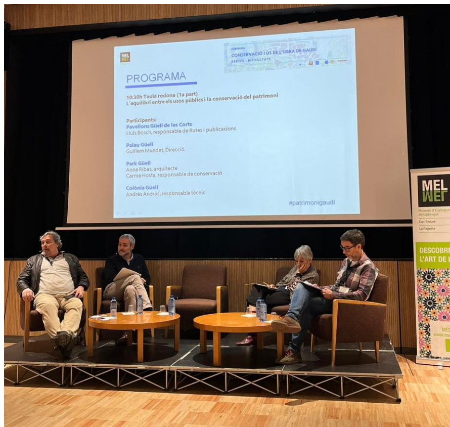
Imatge de la jornada “Conservació i ús de l’obra de Gaudí”

Participació en la jornada “Conservació i ús de l’obra de Gaudí. Reptes i dificultats” organitzada per l’ajuntament d’Esplugues de Llobregat i els Museus Esplugues de Llobregat el dia 4 de febrer.