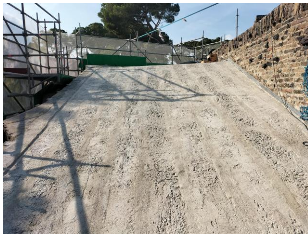
Imatge de la substitució de la planxa de zinc en les escales d'accés església