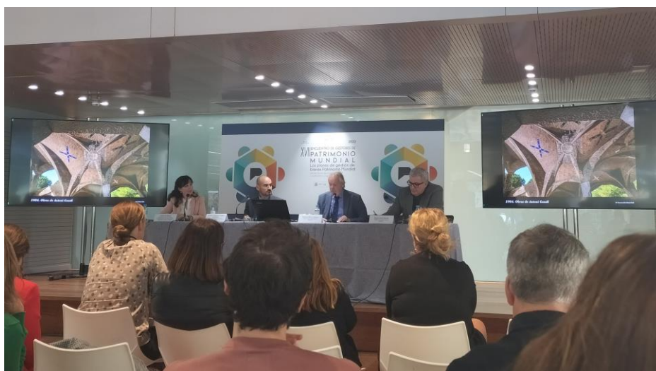
Imatge del XVII Trobada de gestors de Patrimoni Mundial a Madrid

XVII Trobada de gestors de Patrimoni Mundial, organitzat pel Ministerio de Cultura y Deportes, sota el títol “Els plans de gestió de bens patrimoni mundial” celebrada a Madrid.