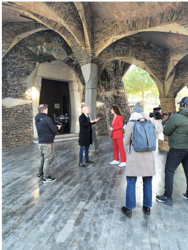
Imatge de la gravació del programa “Los pilares del tiempo” de RTVE