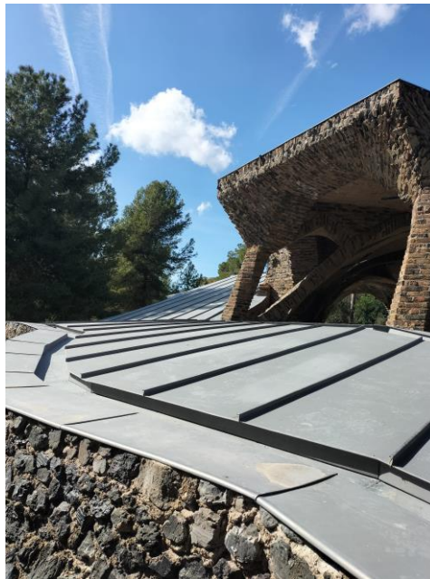
Imatge de la substitució de la planxa de zinc en les escales d'accés església