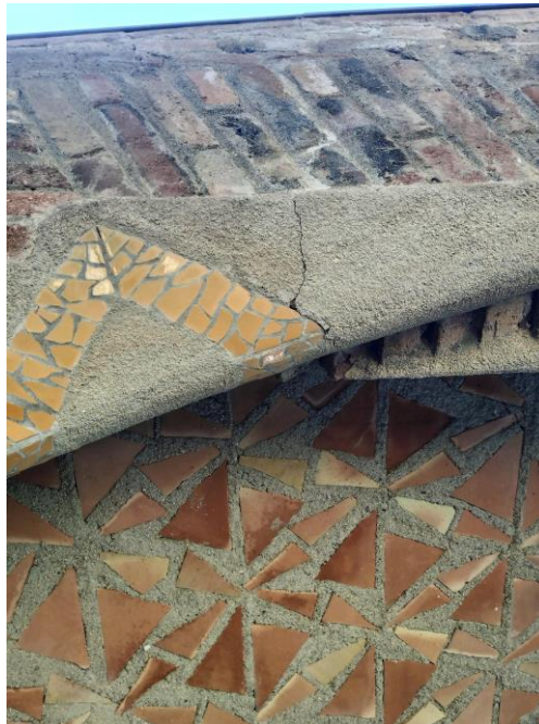
Imatge d'una de les fissures del porxo d'accés a la Cripta.

Al llarg del 2023 s'han realitzat diferents presentacions del Pla director de la Cripta de la Colònia Güell, per tal de donar a conèixer aquesta eina de protecció i conservació del bé.