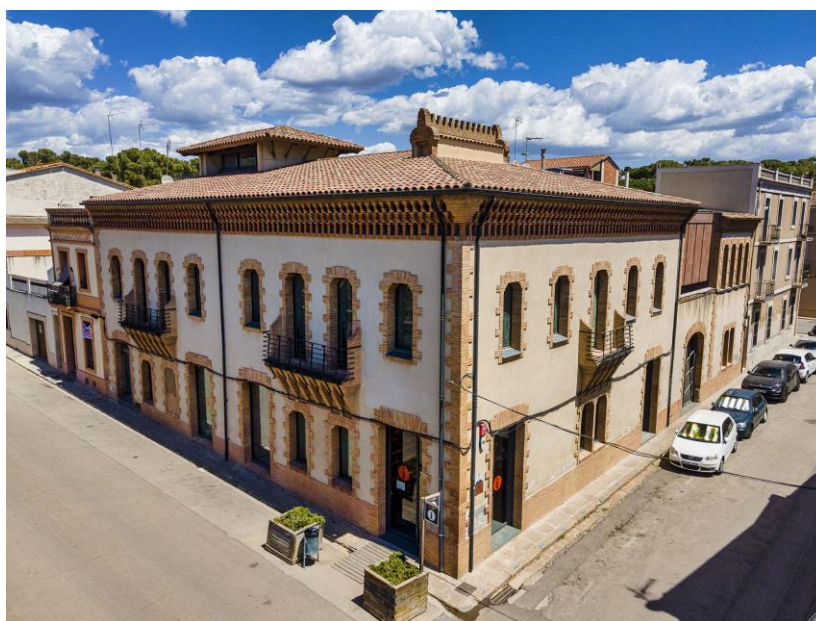
Imatge del Centre d'Interpretació i punt d'informació

El Consorci de la Colònia Güell té una cessió d'ús per part de l'Ajuntament de Santa Coloma de Cervelló, regulada mitjançant un conveni de col·laboració, de l'edifici del Centre d'interpretació i part dels antics cellers, per acollir l'exposició permanent sobre la Colònia Güell i la Cripta de Gaudí, així com ser el punt d'acollida i informació de les persones visitants.