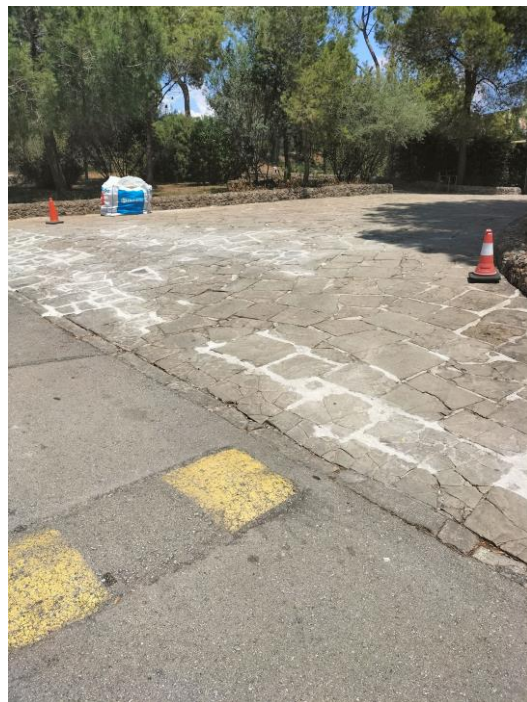
Imatges de la reparació del paviment de pedra de l'entrada al recinte de la Cripta

També es van realitzar les reparacions i/o els manteniments ordinaris de buidat del pou mort, revisió extintors, parallamps, alarma, substitució de bombetes, etc.