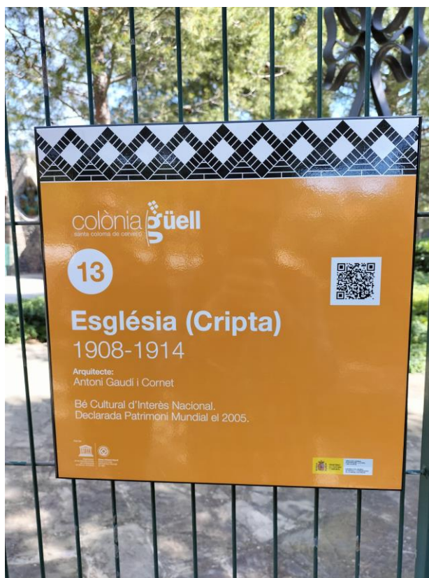
Imatge d'un dels cartells del nou Pla de senyalització

El cost total de l'actuació ha estat de 14.320,15 euros.