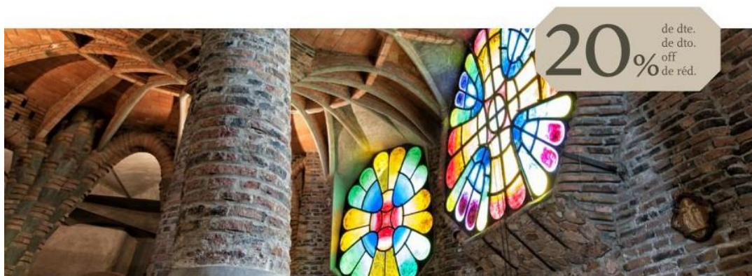
Imatges dels vals de descompte que es lliura a les persones visitants