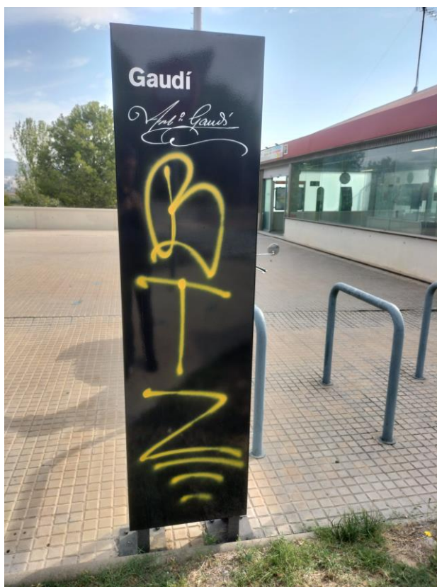
Imatge d'una pintada en un tòtem informatiu.

El 2023 es va seguir patint vandalisme de baixa intensitat a la pineda i a la tanca del recinte de la Cripta, afectant a la vegetació, mobiliari urbà, senyalització, etc. Cal dir també que l'impacte del vandalisme és notòriament baix respecte dels nuclis urbans i espais públics dels municipis de l'entorn. I concretament, durant aquest any 2023, només cal destacar el trencament d'una de les jardineres que es troben a l'entrada del Centre d'Interpretació, el trencament de dues fulles de la tanca del perímetre del recinte de la Cripta i pintades a alguns dels cartells i tòtems informatius del recorregut de la visita guiada pel conjunt de la Colònia Güell.