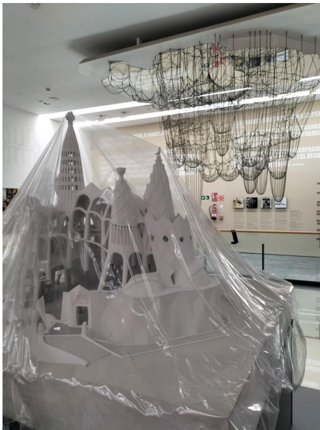
Imatge de les actuacions d'ampliació de l'exposició permanent del Centre d'Interpretació

La licitació es va adjudicar a l'empresa Produccions Culturals Transversal SL. Aquest servei es va iniciar al mes de desembre de 2023, i es va imputar un cost en la primera certificació per import de 22.546,33 euros iva inclòs. Es preveu que tota la instal·lació estigui finalitzada al mes d'abril de 2024.