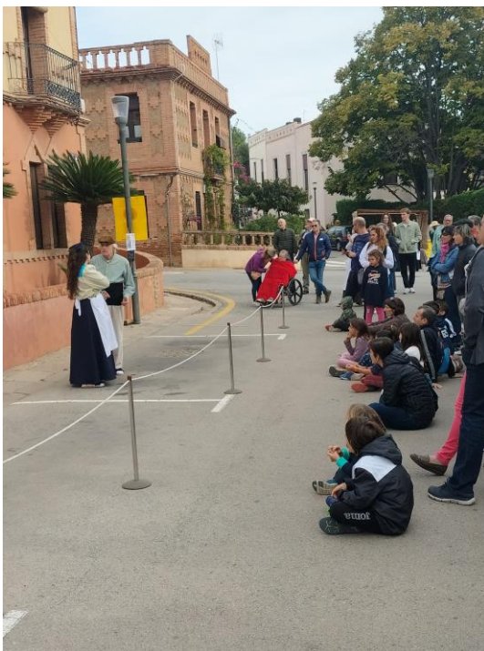
Imatge d'un dels espais teatralitzats de la Festa del Modernisme de la Colònia Güell

El Consorci, com ve realitzant cada any, va donar suport a aquesta nova edició, amb la concessió d'una subvenció de 6.700,00 euros a l'Associació la Colònia Modernistes, entitat responsable de l'organització d'aquesta festa i la cessió de la Cripta per a la realització del concert d'inauguració i presentació de la festa que es va realitzar el dia 20 d'octubre.