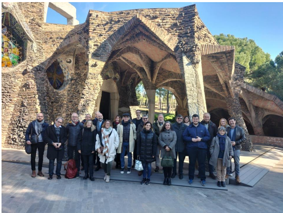
Imatge de les persones assistents a l'acte de presentació del Pla Director de la Cripta del 30 de gener.

El 30 de gener de 2023 es va fer una presentació a les diferents entitats copropietàries de la Cripta, més l'ajuntament de Santa Coloma de Cervelló i els diferents arquitectes que han intervingut en les darreres obres executades dins de l'operació del FEDER. Aquesta presentació es va fer en la mateixa Cripta, per poder presentar in situ, les diferents actuacions de conservació i manteniment que preveu el Pla.