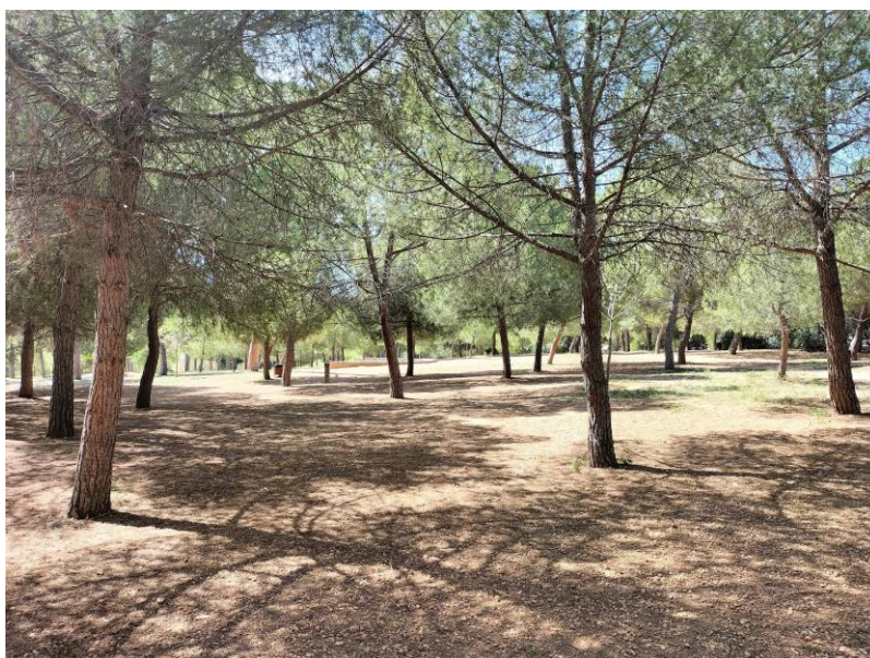
Imatge de la pineda que envolta la Cripta

També cal destacar el manteniment i neteja de les dues fonts de la pineda, en especial per mantenir les canonades de desguàs netes.