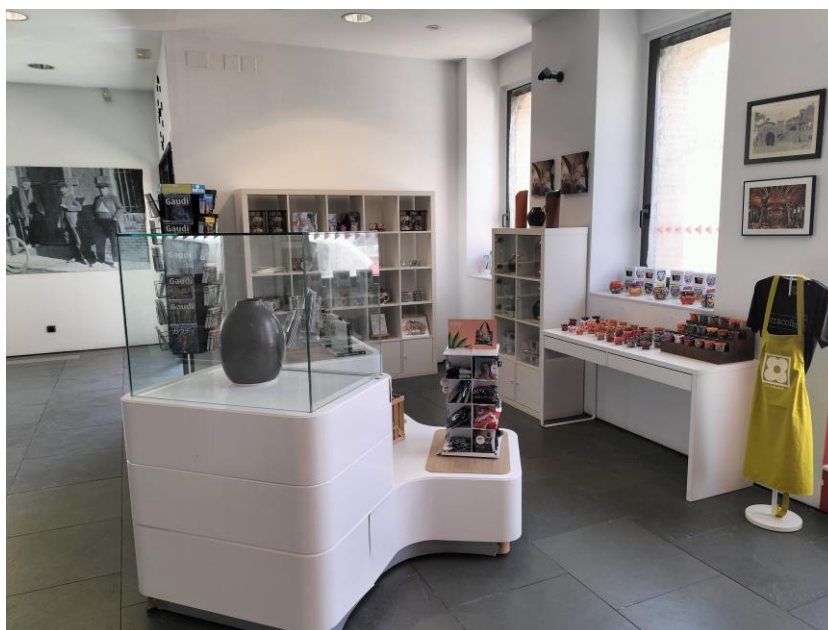
Imatge de la botiga situada al Centre d'Interpretació de la Colònia Güell