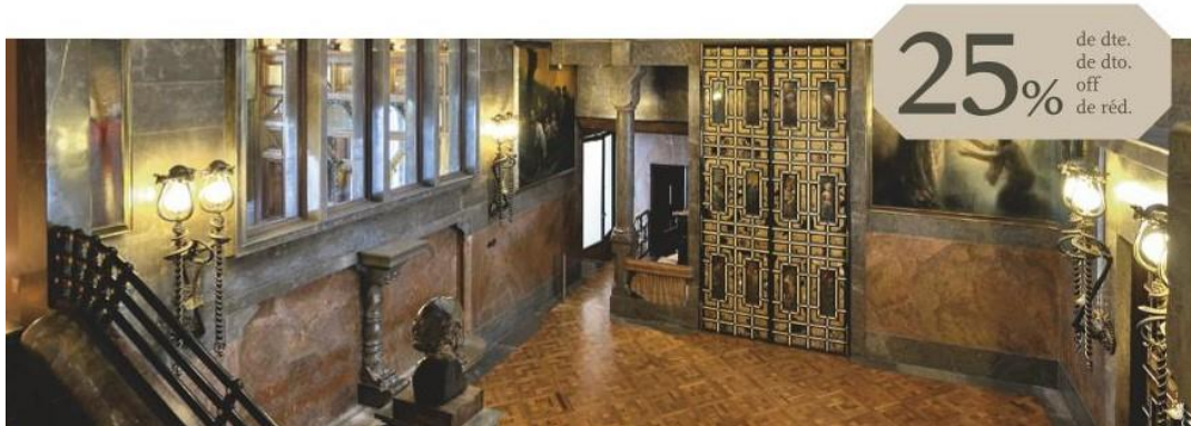
Imatges dels vals de descompte que es lliura a les persones visitants

Présentez ce coupon à la billetterie du Palau Güell et payez votre entrée 9 euros .